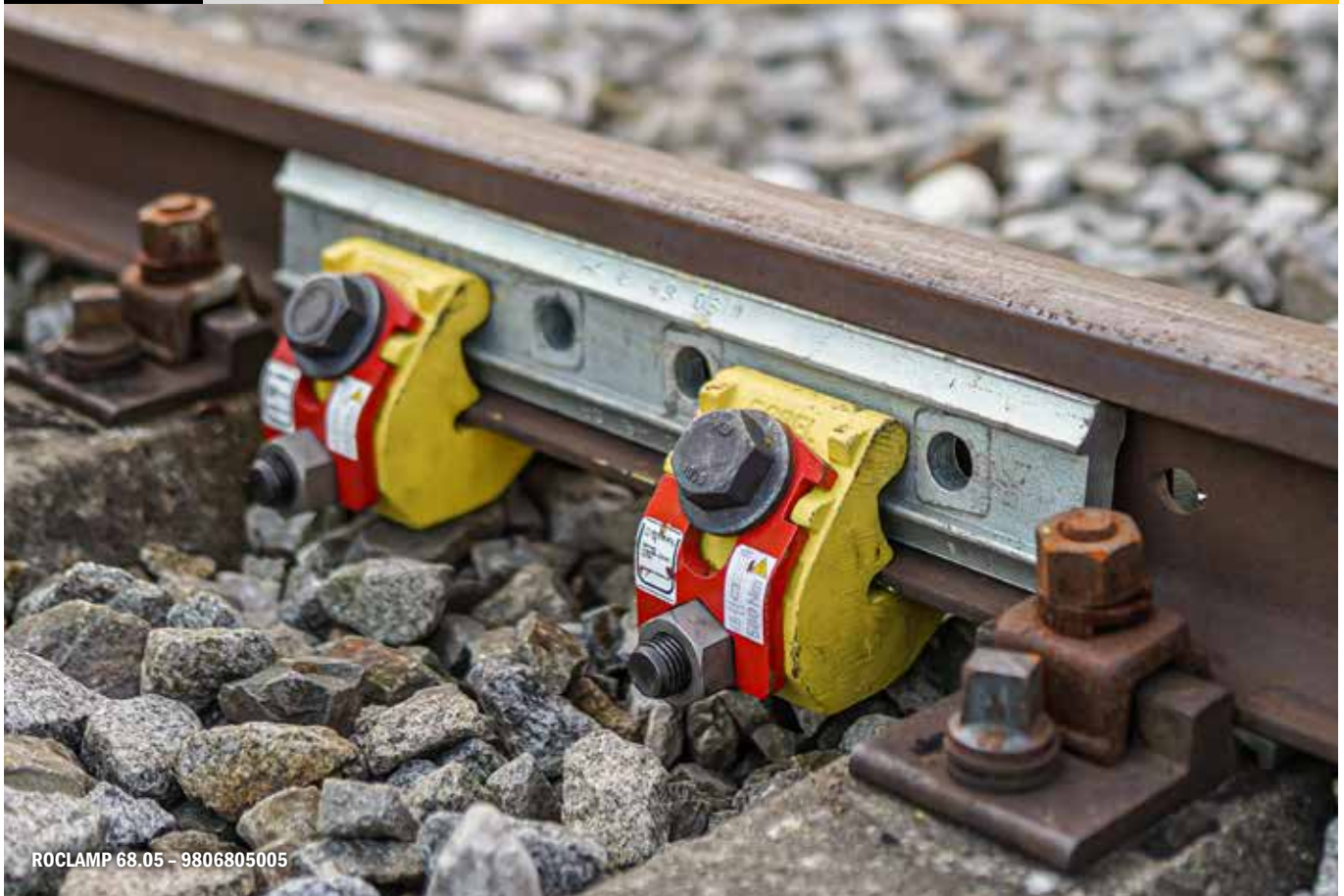
ROCLAMP 68.05 - 9806805005

Zur formschlüssigen und sicheren Verbindung von zwei Schienenenden.