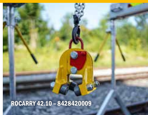
ROCARRY 42.10 - 8428420009