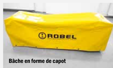
Bâche en forme de capot