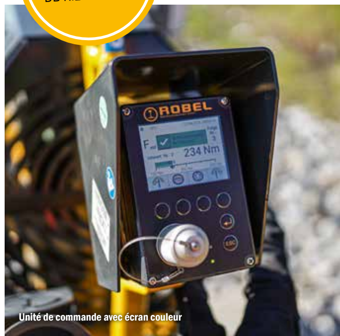
Unité de commande avec écran couleur