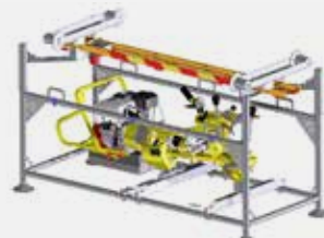
Châssis de transport - 7738960001