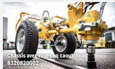
Châssis avec roues en caoutchouc 8320820002