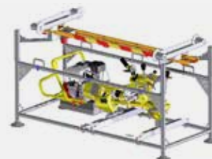
Transportgestell - 7738960001