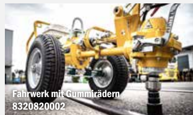
Fahrwerk mit Gummirädern 8320820002