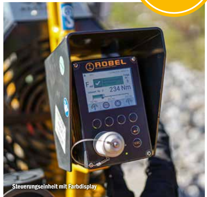
Steuerungseinheit mit Farbdisplay