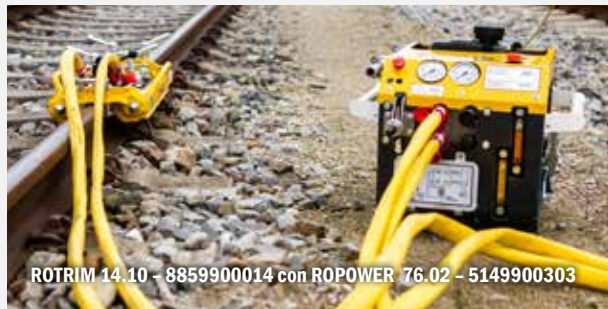
ROTRIM 14.10 - 8859900014 con ROPOWER 76.02 - 5149900303