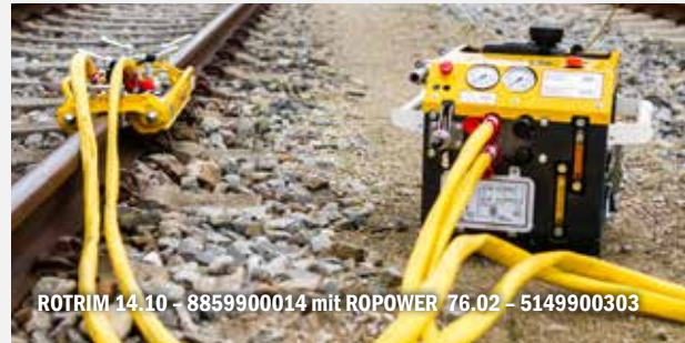
ROTRIM 14.10 - 8859900014 mit ROPOWER 76.02 - 5149900303