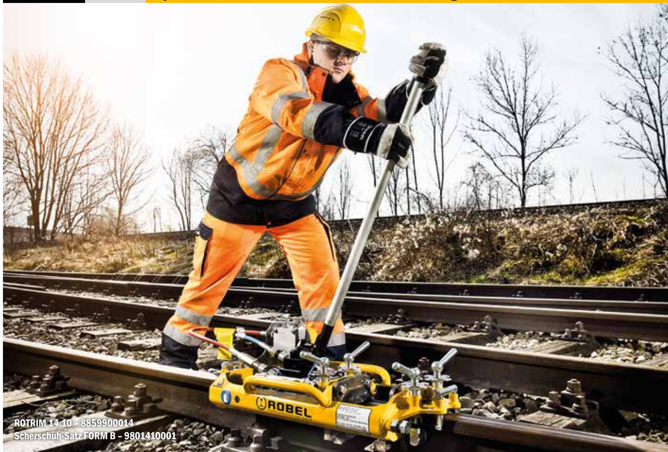
ROTRIM 14.10 - 8859900014 Scherschuh-Satz FORM B - 9801410001

Zum Abscheren von alumino-thermischen Schienenschweißungen.