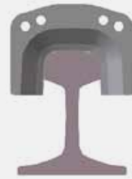
Scherschuh FORM B