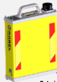
Batería 2300 Wh – 7839900001