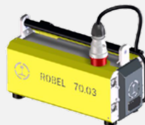
Fuente de alimentación 400 voltios – 5039900003

Estaremos encantados de llevar a cabo la conversión de su máquina de gasolina en Freilassing. ¿Está interesado en comprar una máquina nueva a batería? Póngase en contacto con su interlocutor en ROBEL para más información.