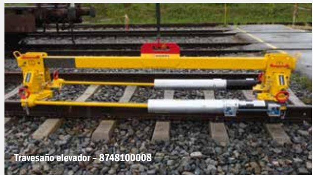
Travesaño elevador - 8748100008