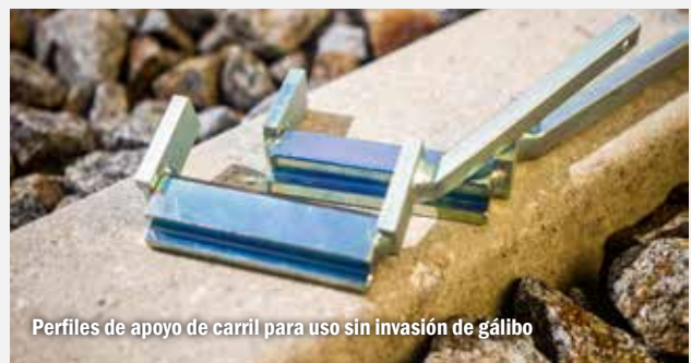
Perfiles de apoyo de carril para uso sin invasión de gálbo