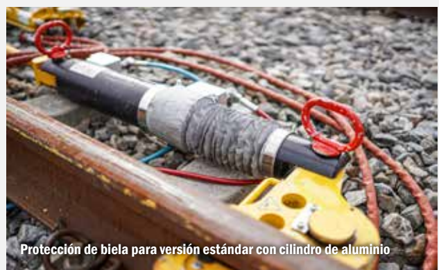
Protección de biela para versión estándar con cilindro de aluminio