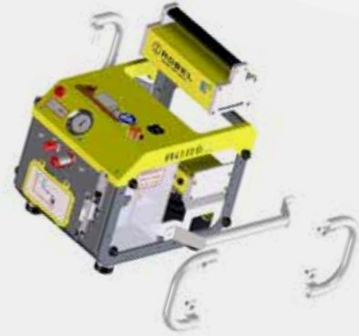
Para operar con ROSTRESS 24.70 véase ROPOWER 76.02/76.20 E 3