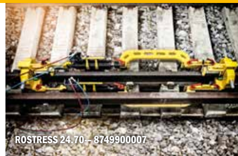
ROSTRESS 24.70 - 8749900007