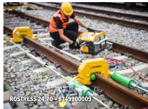
ROSTRESS 24.70 - 8749900009

Das Modulkonzept zum Herstellen einer neutralen Schienenspannung bei Schweiß- und Verspannarbeiten.