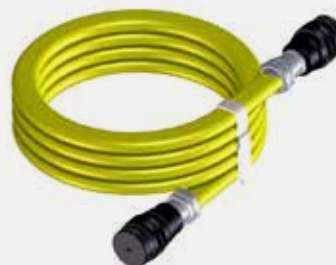
Cable de conexión - 5016060210