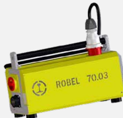
Fuente de alimentación 400 voltios - 5039900003