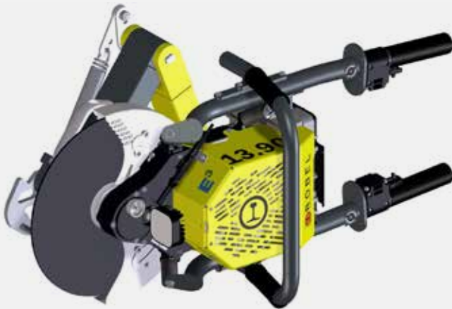
ROCUT 13.90 – 5909900008