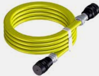
Verbindungskabel – 5016060210