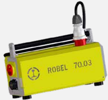
Netzteil 400 Volt – 5039900003