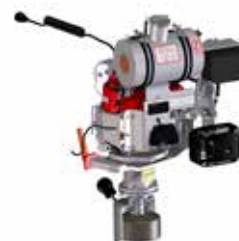
Modul Schienenstegschleifen RGX200