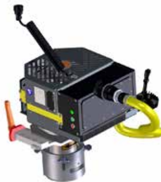
E³-Modul Schleiftopf BLDC-Elektromotor