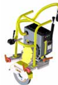
E³-Modul Schleifscheibe BLDC-Elektromotor