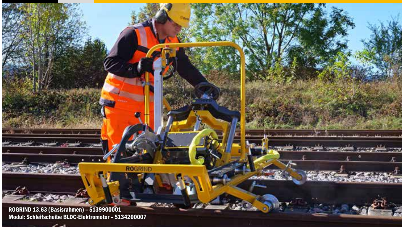
ROGRIND 13.63 (Basisrahmen) – 5139900001 Modul: Schleifscheibe BLDC-Elektromotor – 5134200007

Zum Schleifen von Auftragsschweißungen an Weichenzungen, Herzstücken, Backenschienen und Radlenkern sowie zum Entfernen von Gratbildungen an Schienenköpfen und in Weichen.