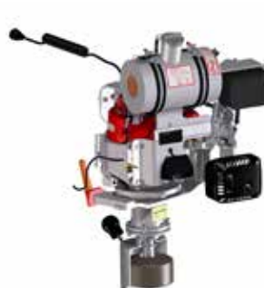
Modul Schienenstegschleifen RGX200