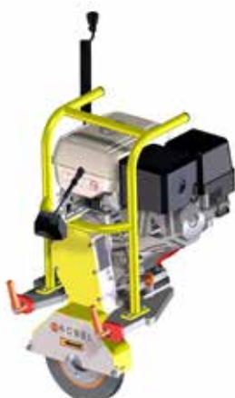
Modul Schleifscheibe GX 270