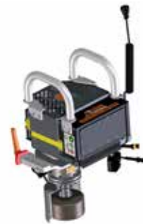
E³-Modul Schienenstegschleifen BLDC-Elektromotor