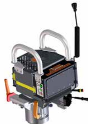
E³-Modul Schleiftopf BLDC-Elektromotor 90°