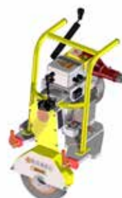
Modul Schleifscheibe Elektromotor