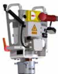
Modul Schleiftopf Elektromotor