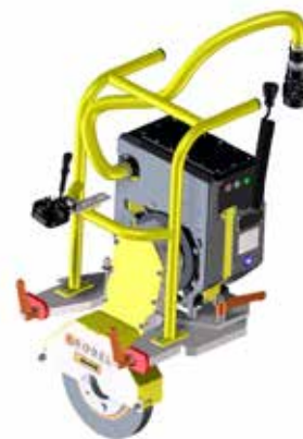
E³-Modul Schleifscheibe BLDC-Elektromotor