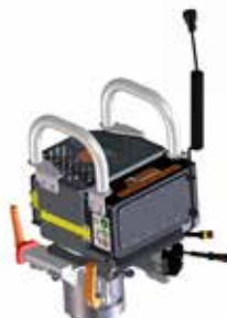
E³-Modul Schleiftopf BLDC-Elektromotor 90°