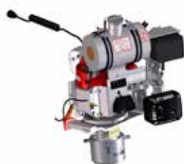
Modul Schleiftopf RGX200