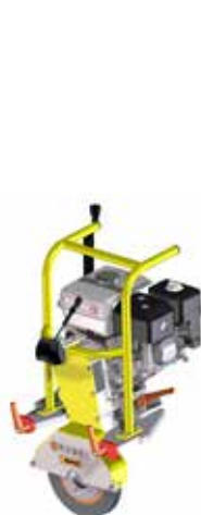
Modul Schleifscheibe GX 200