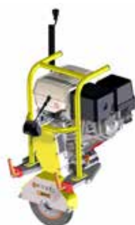
Modul Schleifscheibe GX 270