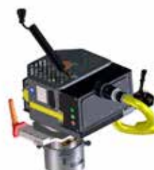
E³-Modul Schleiftopf BLDC-Elektromotor