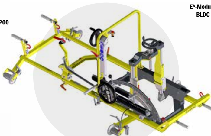
ROGRIND 13.63 BASISRAHMEN