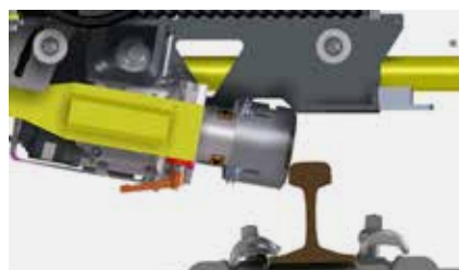
Maximaler Schwenkbereich 32° außen und 80° innen