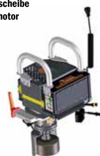
E³-Modul Schienenstegschleifen BLDC-Elektromotor