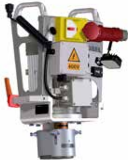
Modul Schleiftopf Elektromotor