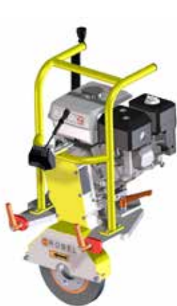
Modul Schleifscheibe GX 200