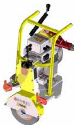
Modul Schleifscheibe Elektromotor