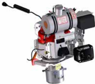
Modul Schleiftopf RGX200