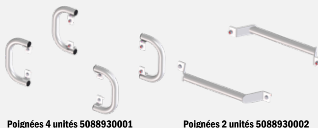
Poignées 4 unités 5088930001