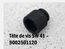
Tête de vis SW 41 - 9002501120