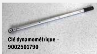
Clé dynamométrique - 9002501790