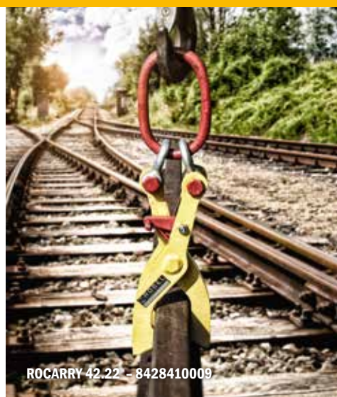
ROCARRY 42.22 - 8428410009