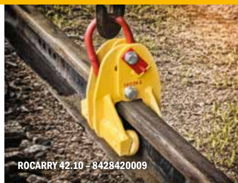
ROCARRY 42.10 - 8428420009