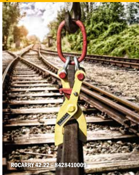
ROCARRY 42.22 - 8428410009