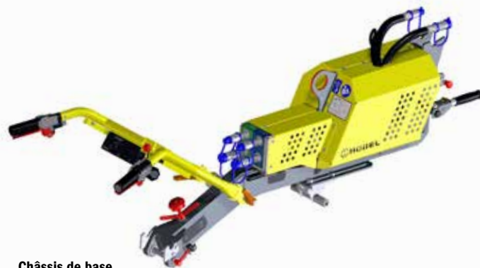
Châssis de base