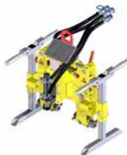
Tête pour attaches clip FC