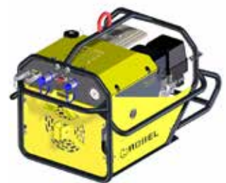
Unité d'entraînement Honda GX270