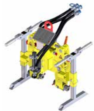
Tête pour attaches clip FC