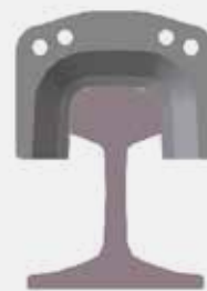
Kits de couteaux FORME B