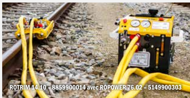
ROTRIM 14.10 - 8859900014 avec ROPOWER 76.02 - 5149900303