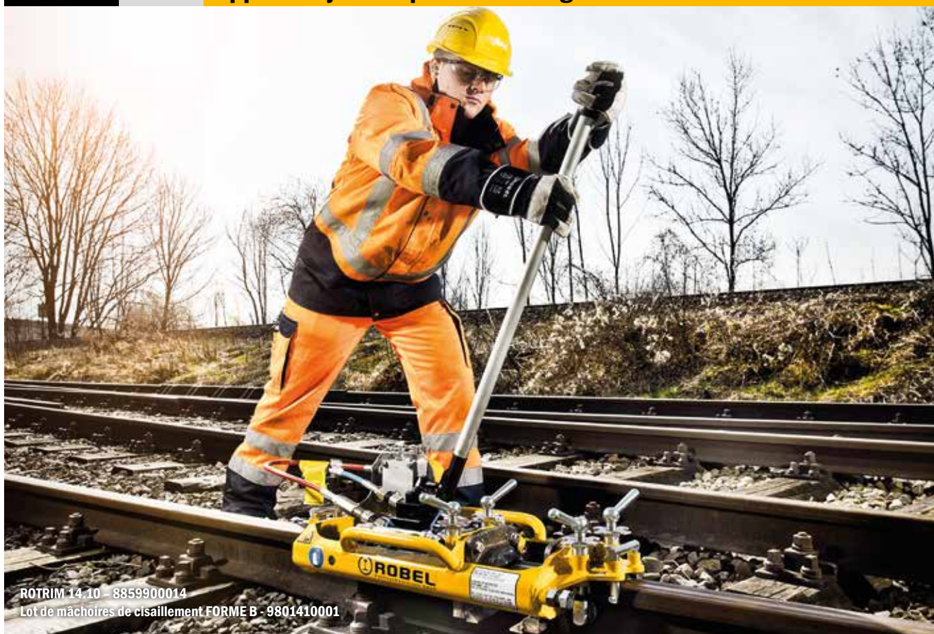
ROTRIM 14.10 - 8859900014 Lot de mâchoires de cisaillement FORME B - 9801410001

Pour ébavurer les soudures des rails par aluminothermie.