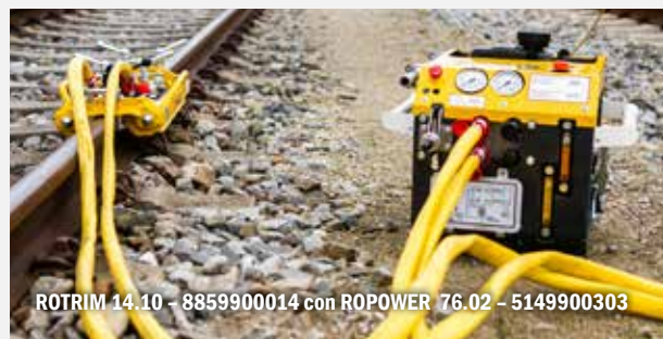
ROTRIM 14.10 - 8859900014 con ROPOWER 76.02 - 5149900303