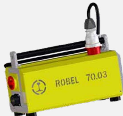
Bloc d'alimentation 400 Volt – 5039900003