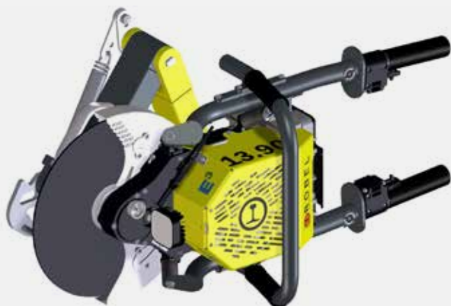
ROCUT 13.90 – 5909900008