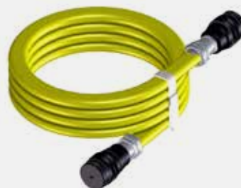
Câble de raccordement – 5016060210