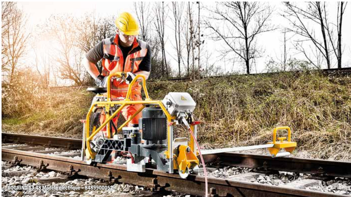
ROGRIND 13.48 Modèle électrique – 8489900052