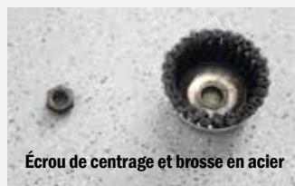
Écrou de centrage et brosse en acier