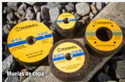
Muelas de copa

9878081000 Ø 90 mm cónica para puntas de corazón y desvíos, fijación por tuerca central M20 (apta también para la superficie de rodadura de carriles de garganta) 9002000330 Ø 90 mm cilíndrica para soldaduras de recargue, fijación por tuerca central M20 9002000687 Ø 125 mm fijación por tuerca central M20 9002000688 Ø 125 mm fijación mediante tuerca 4xM8, diámetro perforación Ø 90 mm 9002000690 Ø 150 mm fijación por tuerca central M20 9002000689 Ø 150 mm fijación mediante tuerca 4xM8, diámetro perforación Ø 115 mm Otras muelas de copa bajo pedido.