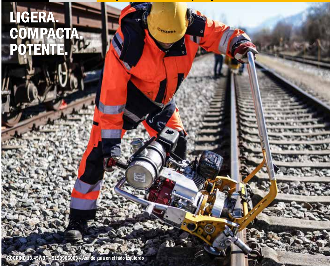
ROGRIND 13.45WBF - 5159906003 - Asa de guía en el lado izquierdo

Para esmerilar con precisión las juntas de soldadura y reperfilear toda la cabeza del carril. También se puede utilizar en la zona de desvíos y para el esmerinado de carriles de garganta.