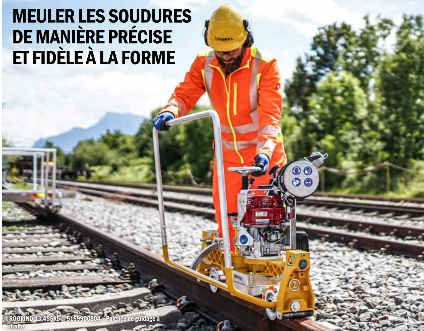
ROGRIND 13.45SKS - 5159900804 - Poignée de guidage à droite

La meuleuse pour le reprofilage du champignon de rail.