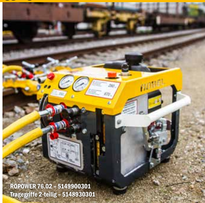
ROPOWER 76.02 – 5149900301 Tragegriffe 2-teilig – 5148930301