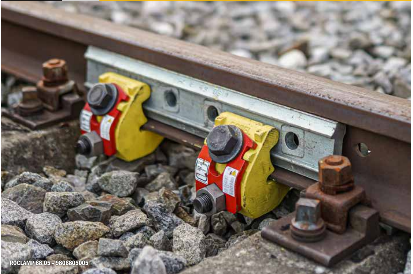
ROCLAMP 68.05 – 9806805005

Zur formschlüssigen und sicheren Verbindung von zwei Schienenenden.