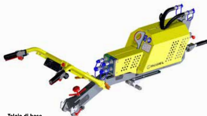
Telaio di base