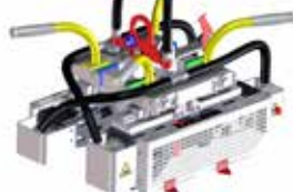
Testa per e-clip