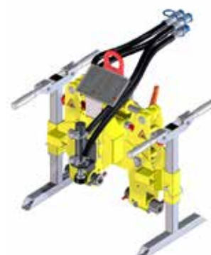
Testa per FC-clip