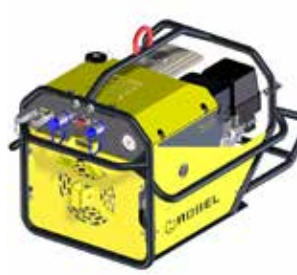
Unità di azionamento Honda GX270