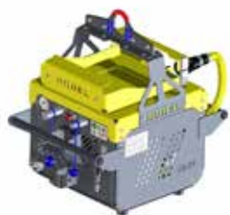
Unità di azionamento BLDC E³