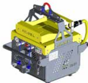
Unità di azionamento BLDC E 3