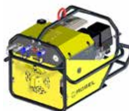
Unità di azionamento Honda GX270