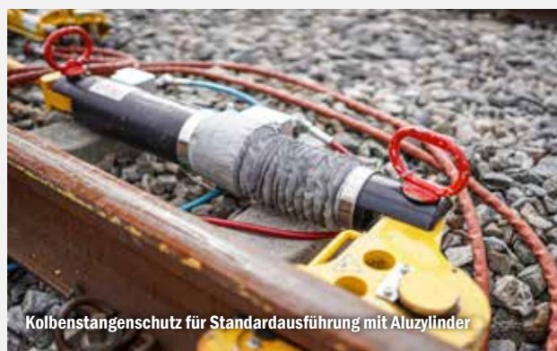
Kolbenstangenschutz für Standardausführung mit Aluzylinder