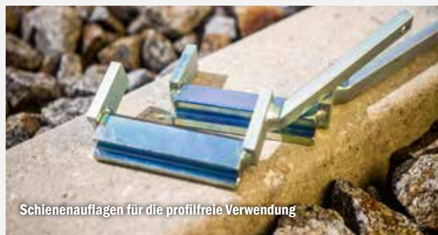
Schienenaufgaben für die profilfreie Verwendung