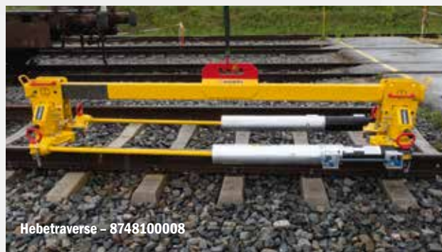
Hebetraverse – 8748100008