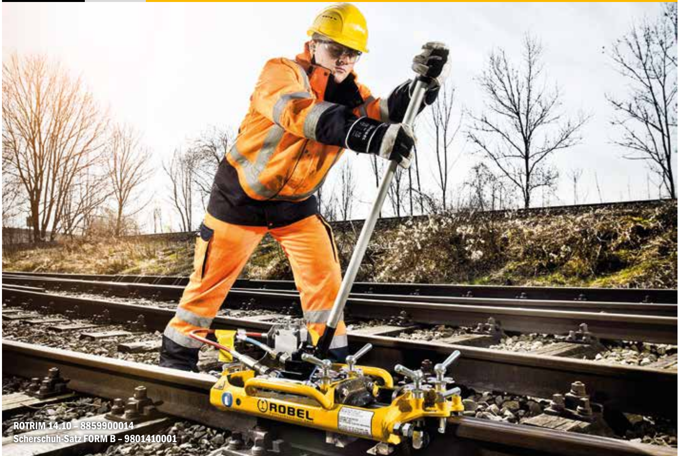
ROTRIM 14.10 – 8859900014 Scherschuh-Satz FORM B – 9801410001

Zum Abscheren von alumino-thermischen Schienenschweißungen.