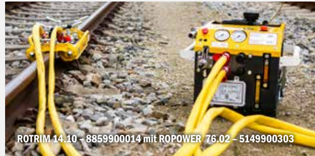
ROTRIM 14.10 - 8859900014 mit ROPOWER 76.02 - 5149900303