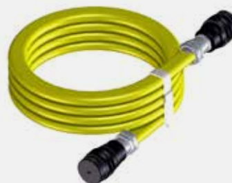
Verbindungskabel – 5016060210