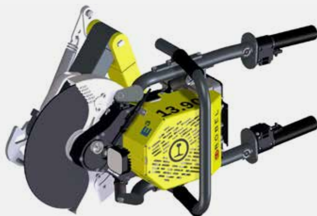
ROCUT 13.90 – 5909900008