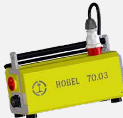
Netzteil 400 Volt – 5039900003