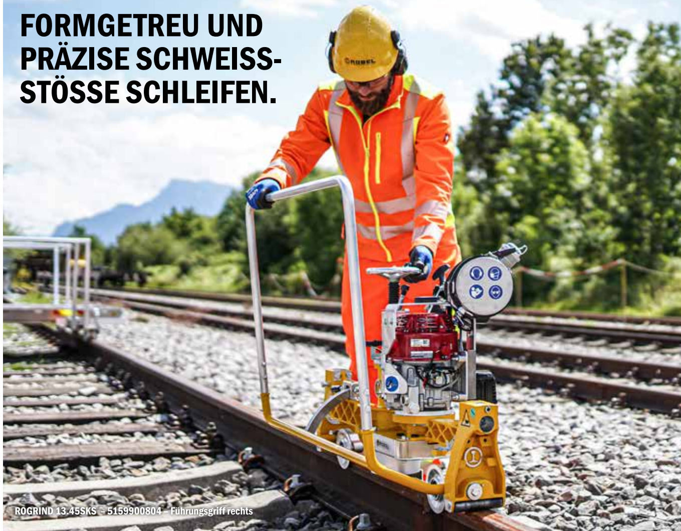
ROGRIND 13.45SKS – 5159900804 – Führungsriff rechts

Die Schleifmaschine zur Reprofilierung des Schienenkopfes.