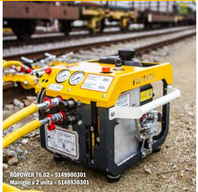
ROPOWER 76.02 - 5149900301 Maniglie a 2 unità - 5148930301