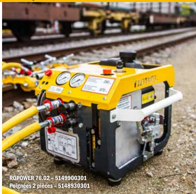
ROPOWER 76.02 - 5149900301 Poignées 2 pièces - 5148930301