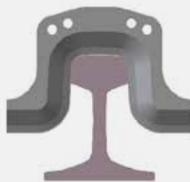
Scarpa di taglio FORMA A (con montante)