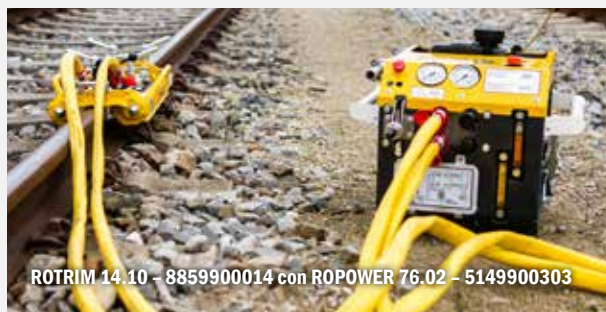
ROTRIM 14.10 - 8859900014 con ROPOWER 76.02 - 5149900303