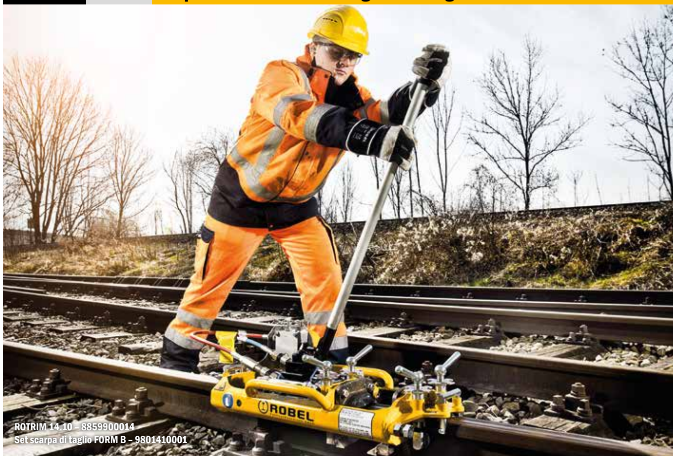
ROTRIM 14.10 - 8859900014 Set scarpa di taglio FORM B - 9801410001

Per il taglio del ringrosso delle saldature alluminotermiche.