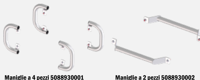
Maniglie a 4 pezzi 5088930001