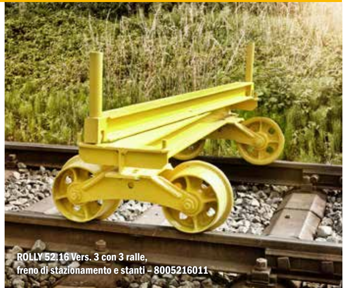
ROLLY 52.16 Vers. 3 con 3 ralle, freno di stazionamento e stanti - 8005216011