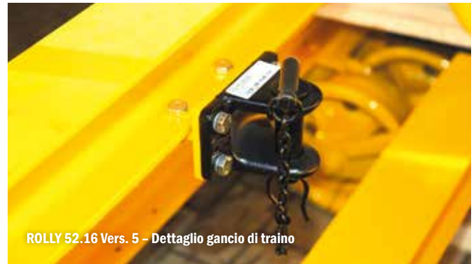
ROLLY 52.16 Vers. 5 - Dettaglio gancio di traino

Barra di traino - 4511850180 Aste di collegamento - 8820032000