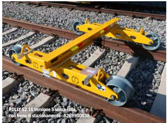
ROLLY 52.16 Versione 5 senza ralla, con freno di stazionamento - 8269900038