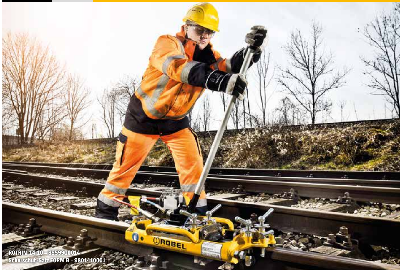
ROTRIM 14.10 - 8859900014 Scherschuh-Satz FORM B - 9801410001

Zum Abscheren von alumino-thermischen Schienenschweißungen.