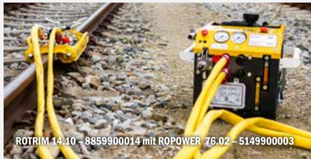
ROTRIM 14.10 - 8859900014 mit ROPOWER 76.02 - 5149900003