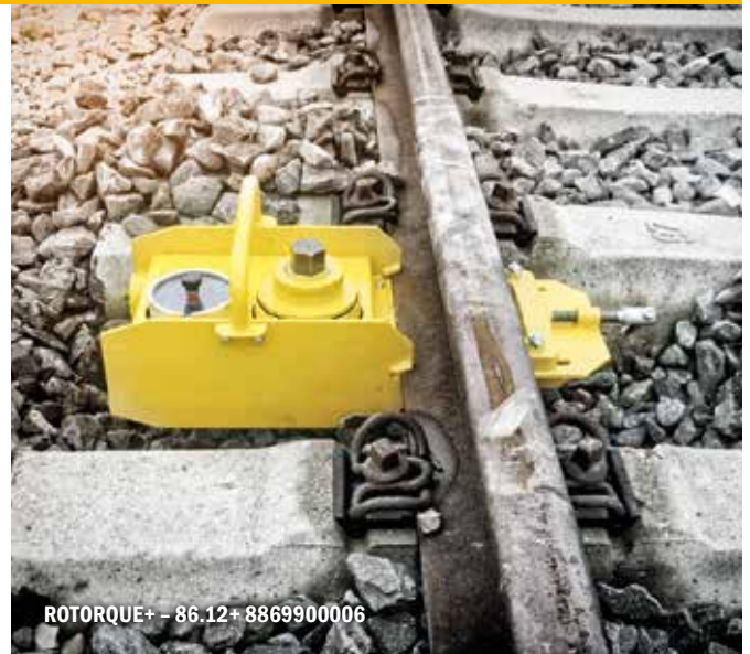
ROTORQUE+ - 86.12+ 8869900006